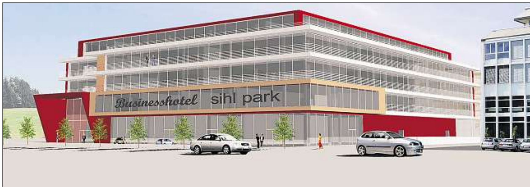
Das Projekt «sihl park» auf der Westseite des Areals Chaltenboden in Schindellegi wird ein zweites Mal aufgelegt. Bereits steht fest, dass die Simmengroup aus Horgen mit 80 bis 100 Arbeitsplätzen einziehen wird. (zvg)

Schindellegi Businesshotel «sihl park» wird noch einmal ausgeschrieben