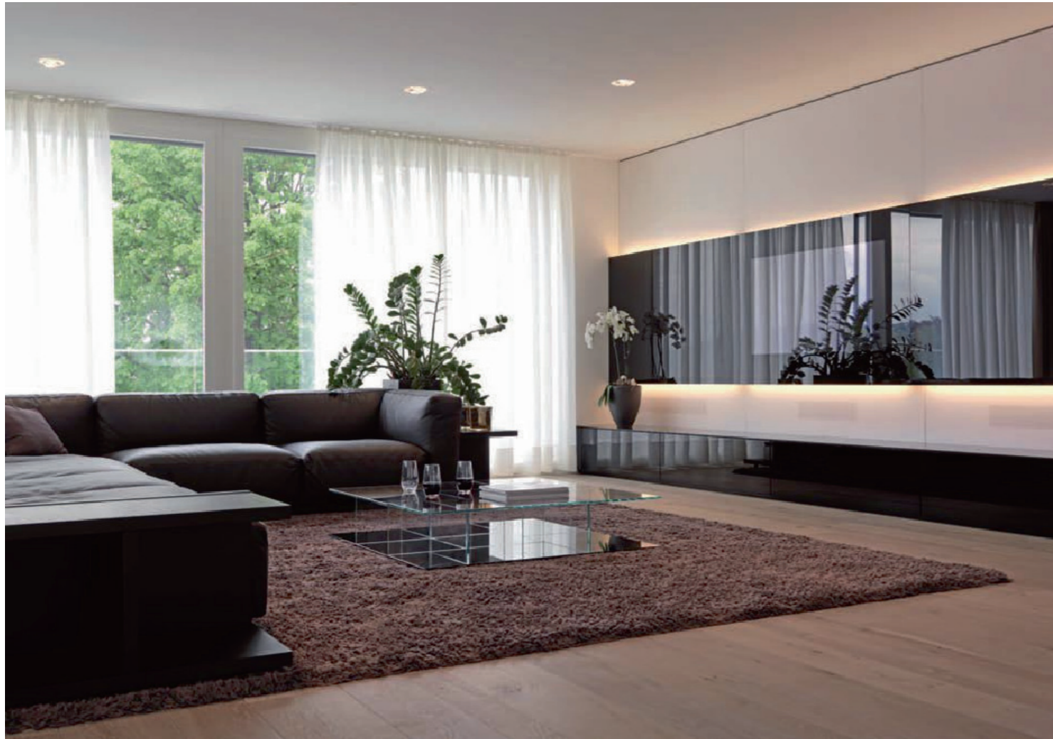
Links oben: Funkelnde Swarovski-Spots erhellen das Wohnzimmer mit Sofa und Glastisch von Cassina. Der Teppich von Danskina besteht aus Bambusfasern. Links unten: Die Türen verschwinden bündig in der Nussbaumfront; das Konzept mit den Lichtstreifen zieht sich durch das gesamte Gebäude. Rechte Seite: Der Essbereich befindet sich im offen konzipierten Wohnzimmer mit Küche. Die Leuchte über dem Esstisch ist von Flos.