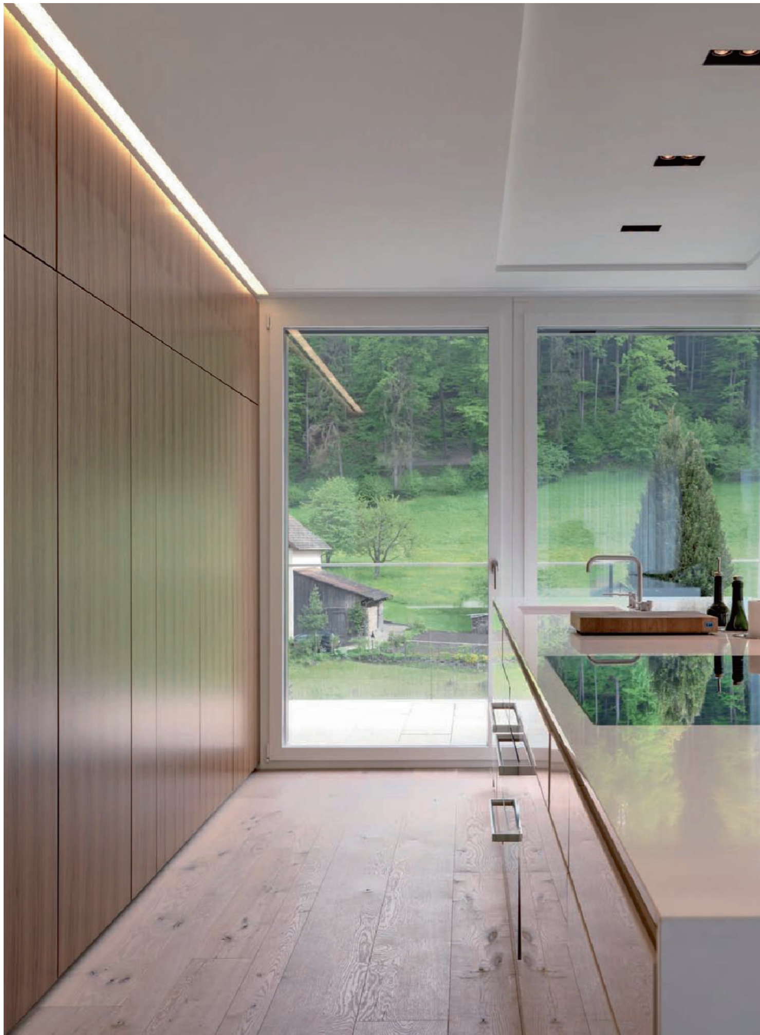
Man wähnt sich kaum in einer Küche: Gerätschaften verbergen sich hinter den Nussbaumschränken.