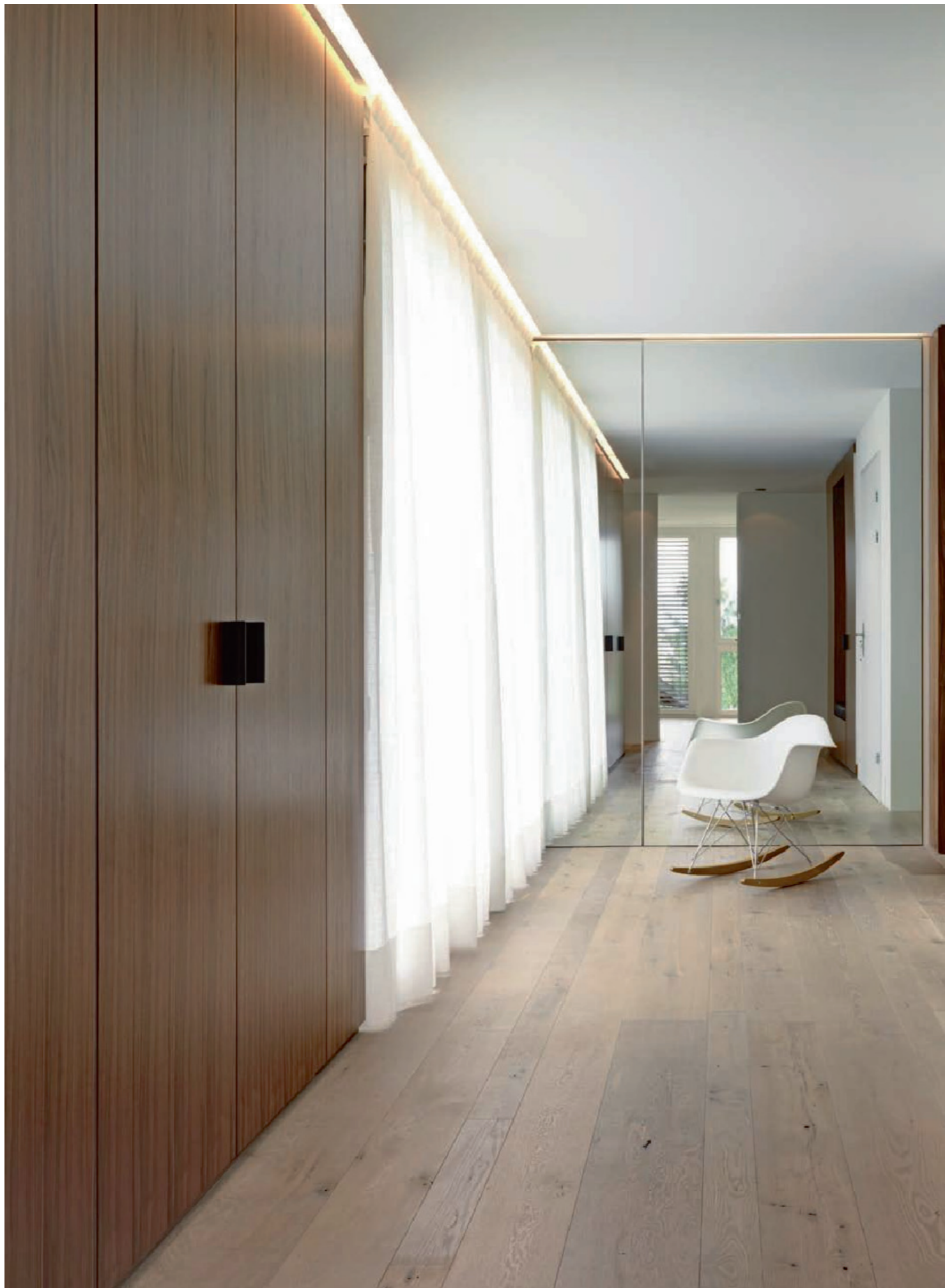
Die wohliche Atmosphäre im Eingangsbereich mit Eichenparkett und Nussbaumschränken wirkt einladend.

Umgeben von mächtigen Lindenbäumen, ragt ein voluminöses Gebäude mit acht Wohnungen und vier Gewerberäumen über die Dächer von Bäch, einer Gemeinde am linken Zürichseeufer, hinaus. Das oberste Geschoss, das vollständig von einer Terrasse umfasst ist, hat der zuständige Architekt Patric Simmen mit seiner Familie gleich selbst bezogen. Der Bau nennt sich nicht ganz unbescheiden «Covered Diamond». Sein Name rührt daher, dass die Fronten hauptsächlich aus Glas bestehen, diese aber verdeckt werden von eloxierten Aluminiumbändern, die aneinandergereiht eine Länge von 28 Kilometern ergeben würden. Von innen hat man so den Vorteil, dass man sehr gut hinaussehen kann, Einblicke von aussen aber sind durch die schmalen Spalten kaum möglich. Je nach Lichteinfall wirkt die Fassade völlig anders, mal wie dunkles Holz, dann wieder eher sandfarben oder gar silbrig funkelnd.